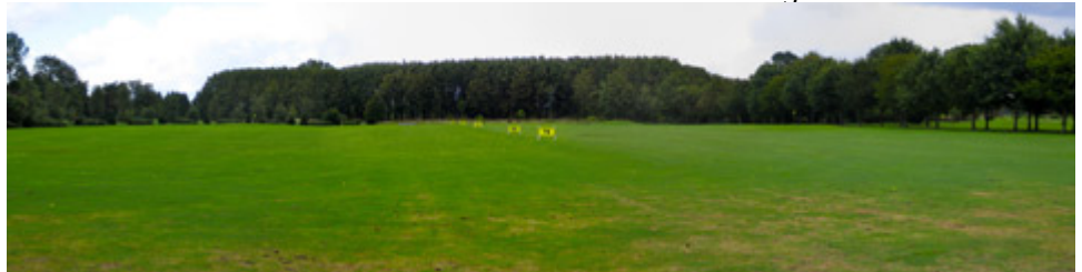
Driving Range in Wiesmoor Driving Range GC Ostfriesland