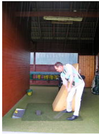
Übungseinheit in der